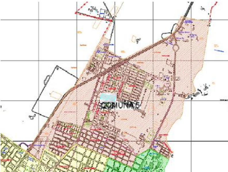
Mapa Comuna 5