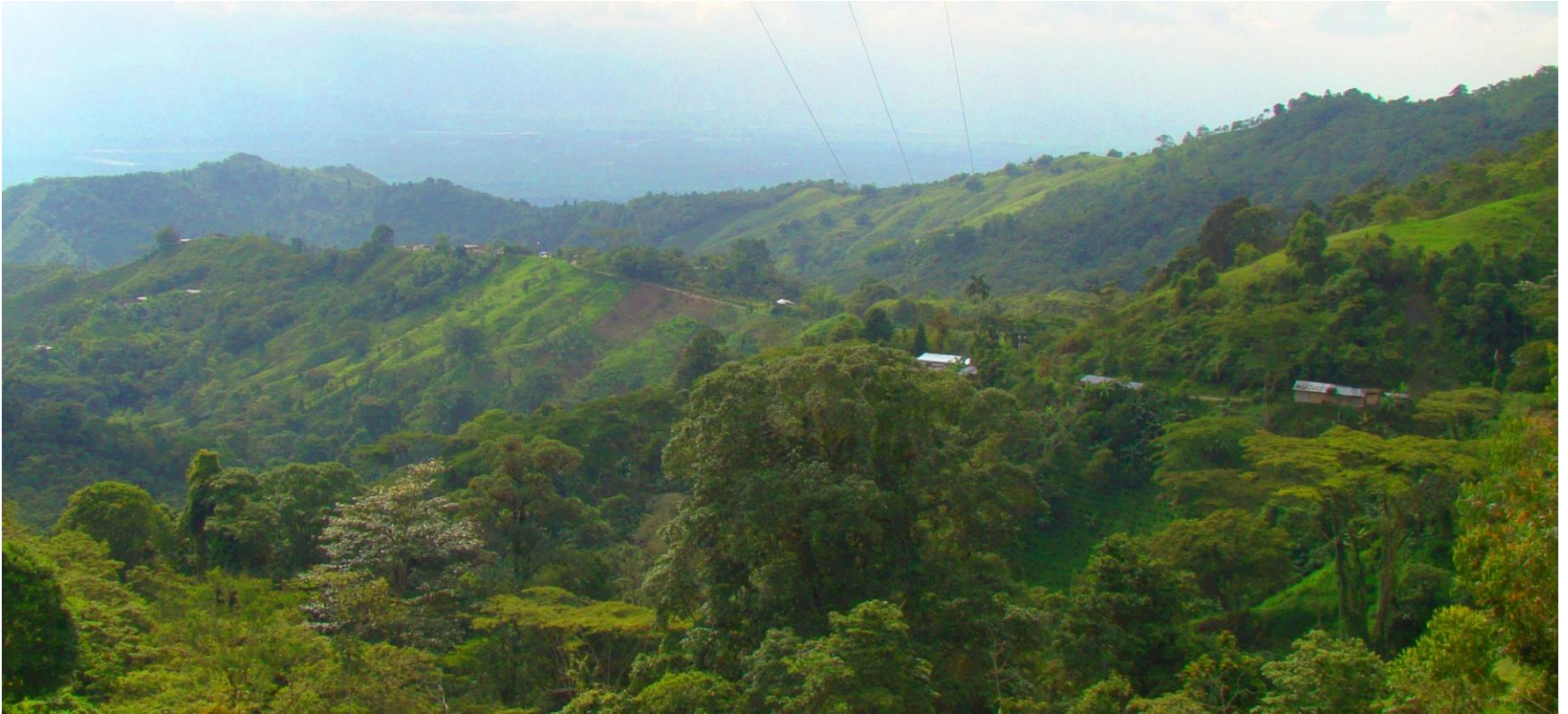
Foto Vereda Los Medios, Mayo 2011